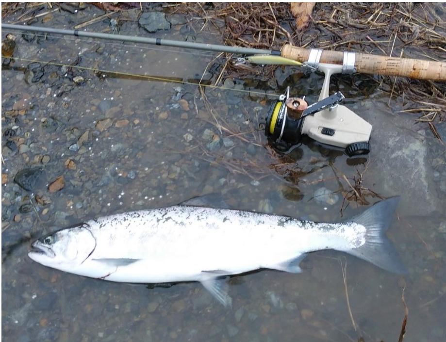
この魚は「サツキマス」

前施設でも 1 年以上通院はされておられなかったようです以前は毎日デイに通われていたのでこちらでもデイサービスやカラオケなど楽しみになることへお誘いさせていただきます。また、治療が必要であれば通院もさせていただきます