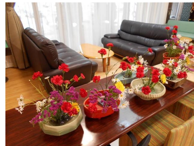
利用者の感性がひかる作品

届いた花を、花バサミでカットし、利用者様が、いろいろな想いで剣山に生け込んでいきます。