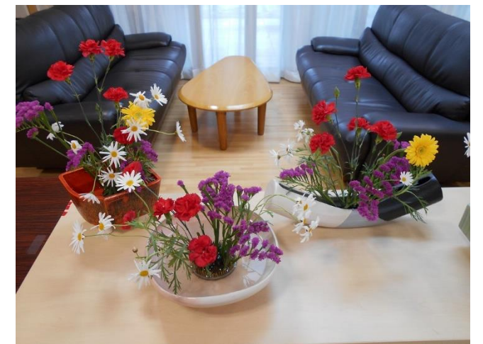
皆さんの個性が表現されます