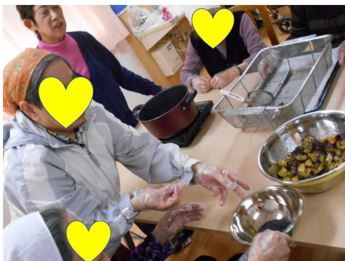
最後の仕上げです！！

これまでに月例で、「パンプキンケーキ」・「たこ焼き」・「ピザ」・「大学芋」・「柿のス ムージー」を調理しました。活動中は、みんなでワイワイとにぎやかにお話を楽し む場面もあれば、時には緊張感のある真剣な眼差し、また時には、調理工程で 利用者同士が意見をぶつけ合う・・・なんてこともありました。みんなで笑ったり、 怒ったり、実食で喜んだりといった喜怒哀楽の感情やお気持ち。これって実は「人」 の暮らしのなかでとても大切なんですよね。お1人でお部屋で過ごしていたら決し て生まれることがない、みんなで集まったからこそできる「笑顔」、みんなで真剣に 調理するからこそ生まれる「意見のぶつけ合い」、みんなで一生懸命に作ったからこ そ味わえる「喜びのスパイス」。そんな素敵な感情や気持ちを「料理クラブ」で味 わってみませんか。「料理をしてみたい。」というお気持ちがあればどなたでも参加 可能です。興味のある方は、是非お近くの職員までお申し出下さいね。ご参加お待 ちしていま～す(^O^)