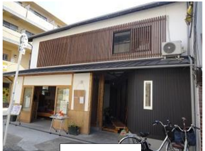
ここがここ家です

ひとりぐ かた か ものがえ かた た よ ばしょ め ぎ お一人暮らしの方や、買い物帰りの方も、どなたでもふらっと立ち寄れる場所を目指 しています。こんご ち いき うんえい にな い 今後は地域みなさまにもサロンの運営を担っていただき、生きがいや やりがいをかん かんが おも 感じていただけるよう、考えていきたいと思ひます。