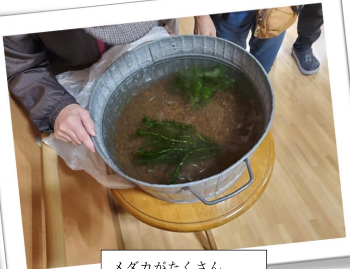
メダカがたくさん

メダカ また ひっこ 越ししました あた しんきょ す 新 しい新居で過ごしています。