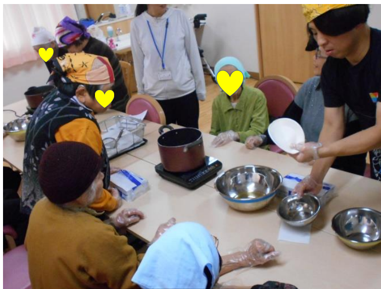
作り方説明！ 熱心に聞き入る皆様