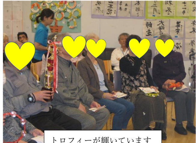
トロフィーが輝いています