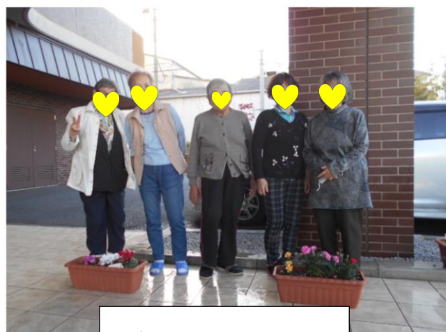
園芸クラブの皆様です。