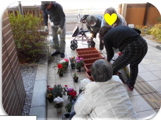
みんなで一緒に作業