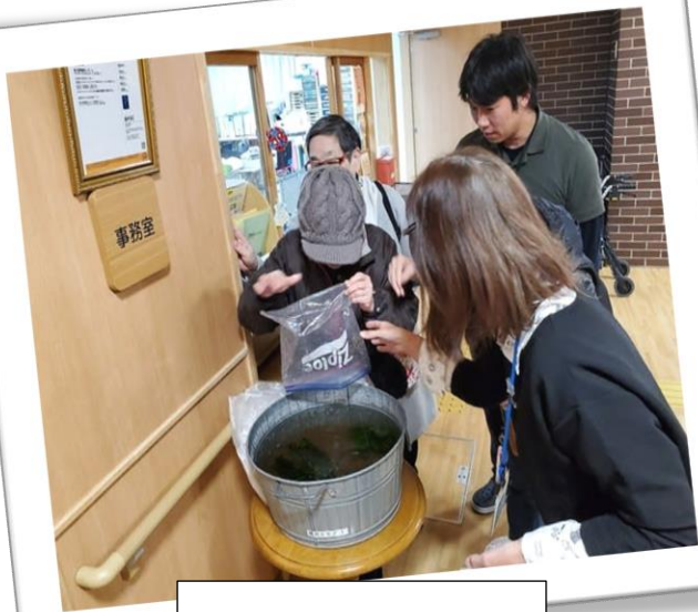
引っ越しの瞬間です。

☆ ビオトープ とは？ しょくぶつ はち そだ こと メダカや植物を鉢で育てる事 ～ はな たいせつ いのち 花もメダカも大切な命です。みなさん、あたたかく見守ってくださ いネ！～