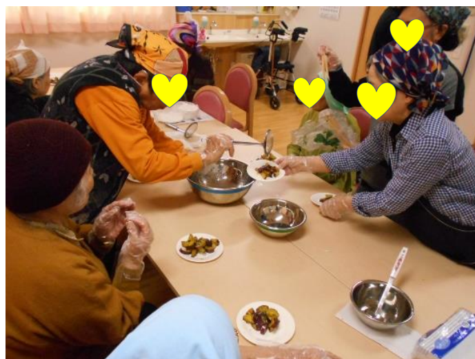
皆さんでいただきますよ♪