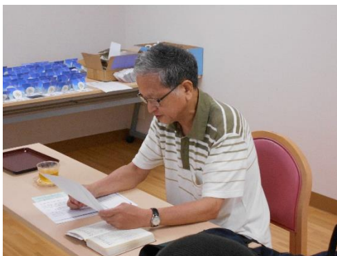
先生がお手本を見せて下さいます