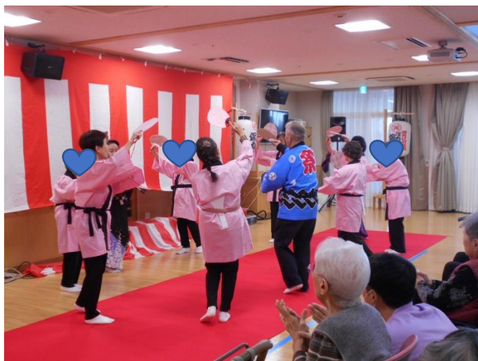
ふれあい祭りでの発表のご様子