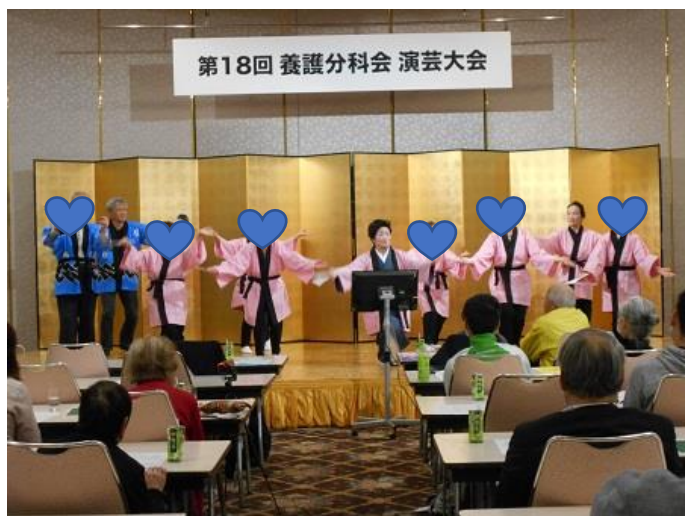
毎年、演芸大会にて発表しています。

かつどうじ かん やく 1 じ かんくらい 活動時間は10：00～11：00 で約1時間位です。