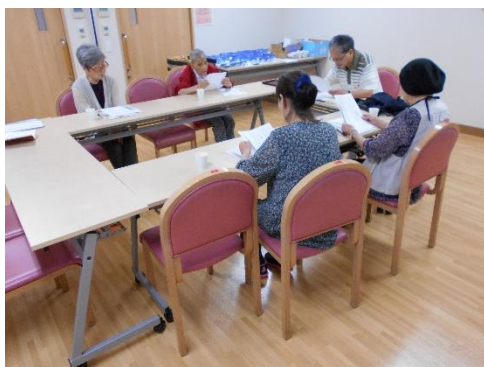
吟じ方を学んでいます。

はっさん しせい よ けんこう い し こうけん 発散、姿勢も良くなり健康維持に貢献します